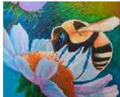
Janine Couratier-Le bourdon butineur

Présenter leur travail et leur évolution et les partager avec le public est l'objectif de leur démarche.