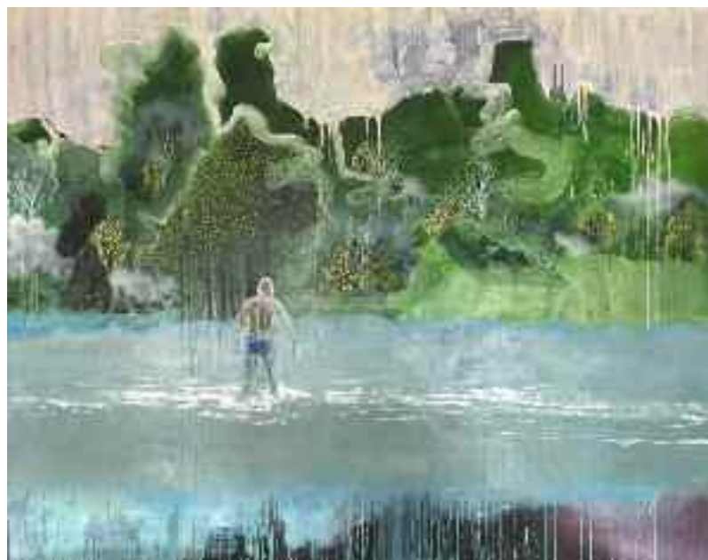
Dans le verdon, 2023, 160x200cm, huile sur toile