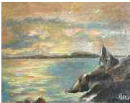
Couchant sur le Brusc

"Ancienne élève des Beaux-Arts de Marseille, j'ai organisé de nombreuses expositions à Narbonne, Nice, Gap, Toulon et Ollioules.