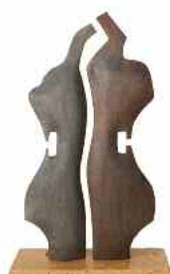
Série Flamme hypnotique avançant sans bruit - wS 4 Dimensions : 34,5 x 19 cm Matériau utilisé : tilleul