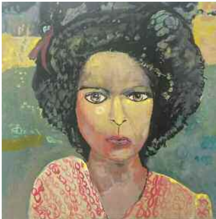
Les idéaux flamboyants

"J'aime raconter des histoires dans mes tableaux, avec une part d'insolite ou d'énigmatique qui laisse au regardeur la liberté de créer son propre mythe. Comme un fragment de scène, avec un avant et un après ouverts à l'interprétation. Cette interaction nourrit mon travail et mes idées. Je cherche à garder une vision poétique du monde, imaginaire et intemporelle. Je suis une grande marcheuse. La promenade errante est devenue une habitude vitale. Mon oeil s'arrête sur un textile, un visage, une posture, un détail, et c'est le début..." Son oeuvre, alliant symbolisme et poésie, se décline en gouaches et peintures à l'huile, proposant des portraits et des scènes de vie.