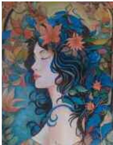
Femme Art Déco