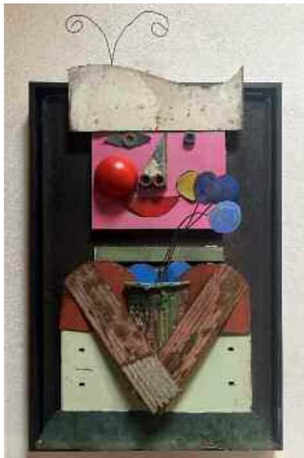
Jeune femme au chapeau baleine

Je remercie cette terre féconde que l'homme maltraite et qui une fois de plus lui montre la voie de la sagesse et de la générosité. Préservez la nature, témoignez-lui de l'amour ou elle vous engloutira avant l'heure et moi je ne serai pas toujours là pour vous ressusciter.