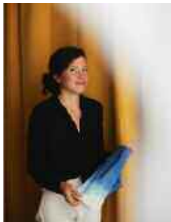
Portrait_ChBracho © Mathias Bracho-Lapeyre