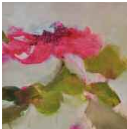
Fleur, huile sur toile, 30x30

Dans de fines couches d'huile, des fleurs s'épanouissent, calmes, et pourtant d'une force intérieure.