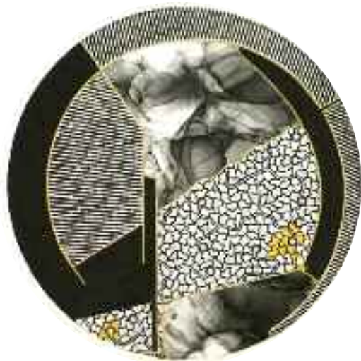
LimbiCelluLa / série A #3 - 35x35cm Gravure sur linoléum et techniques mixtes (encre, trait à la plume, collage)