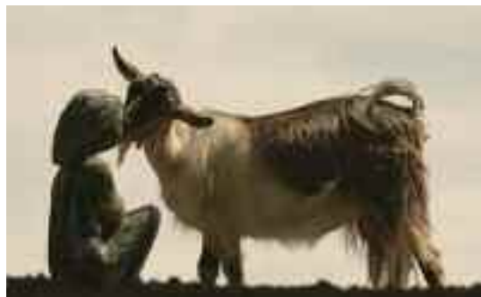
Benera+Estefan, Desfacerea Lumii, 2024