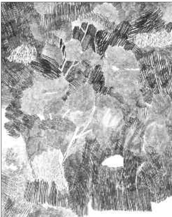
LA PINEDE (Le Brusac) n°18 - Graphite sur papier 62 x 50 cm, 2024 — © Olivier Marty

Lors d'un séjour au Brusac en avril 2024, le peintre a réalisé une dizaine de grands dessins, de mémoire, au retour de ses promenades sur les hauteurs du Mont Salva. Cet ensemble, "La pinède", poursuivi à l'atelier toute l'année suivante, compte quarante cinq dessins, autant de variations sur le souvenir du mistral et de la lumière des sous-bois. Une partie est présentée ici, en dialogue avec d'autres évocations de paysages (Collioure, Rome, le Finistère, la côte d'Opale...), toujours situées sur la frontière sensible entre description et abstraction.