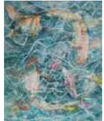
Adeline Dupont-La ronde

Ses compositions, souvent dominées par des bleus omniprésents, déclinent toute la richesse chromatique de l'eau en mouvement, avec la lumière et les reflets, brouillant la distinction entre réalité et perception.